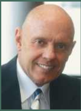
Dr. Stephen R. Covey